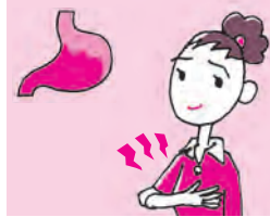
2 胸やけの原因となる胃の 上部の荒れた胃粘膜に