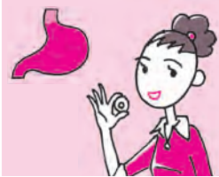
1 かみくだくと有効成分が じわじわと食道を通過して